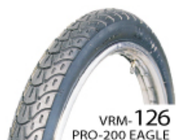
VRM-126 PRO-200 EAGLE