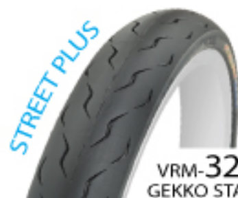
VRM-329 GEKKO STAR