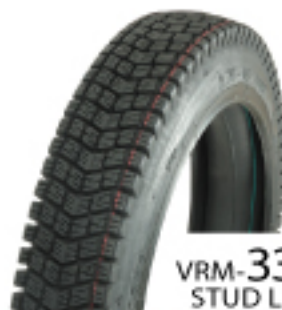
VRM-339 STUD LESS