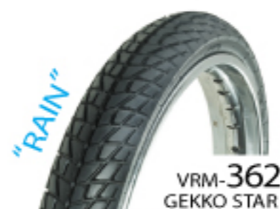
VRM-362 GEKKO STAR