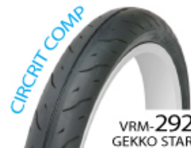
VRM-292 GEKKO STAR