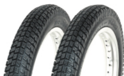
VRM-331 STUD LESS