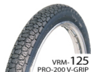
VRM-125 PRO-200 V-GRIP