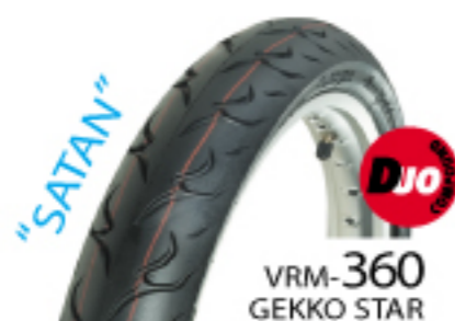
VRM-360 GEKKO STAR