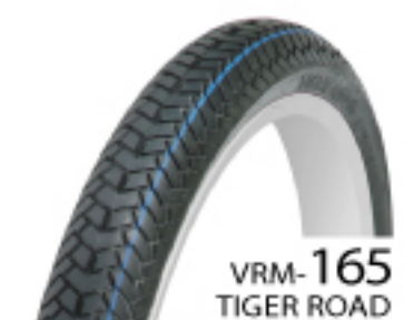
VRM-165 TIGER ROAD