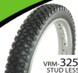
VRM-325 STUD LESS